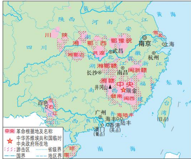
▲ 1929—1932年农村革命根据地分布示意图

地图 2：华北抗日根据地（图二是 1936 年以后边区政府分布图，有图例，在延安有一颗红星标志）