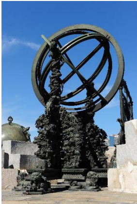
坐落于北京天文馆 古观象台的玑衡抚辰仪

9. 玑衡抚辰仪由十八世纪在华任职的欧洲学者主持设计，是中国古代传统仪器制度与西方计量刻度的完美结合。2024年初，中国驻斯洛文尼亚大使馆与北京天文馆合作，利用3D技术制作了玑衡抚辰仪一比一复制品，并赠送给设计者的家乡——斯洛文尼亚。下列理解正确的是（ ）